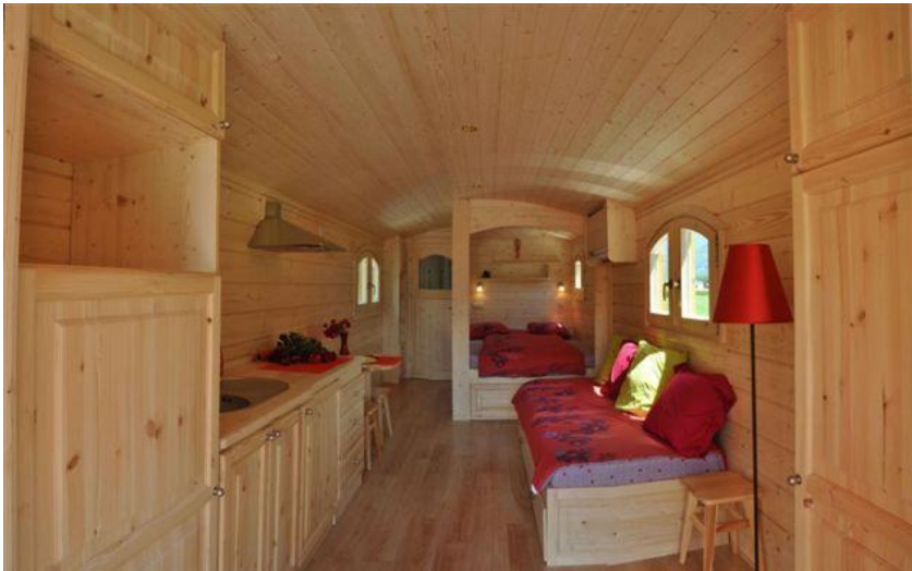
Salon vue general