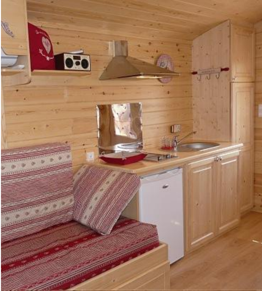
Salon coin cuisine