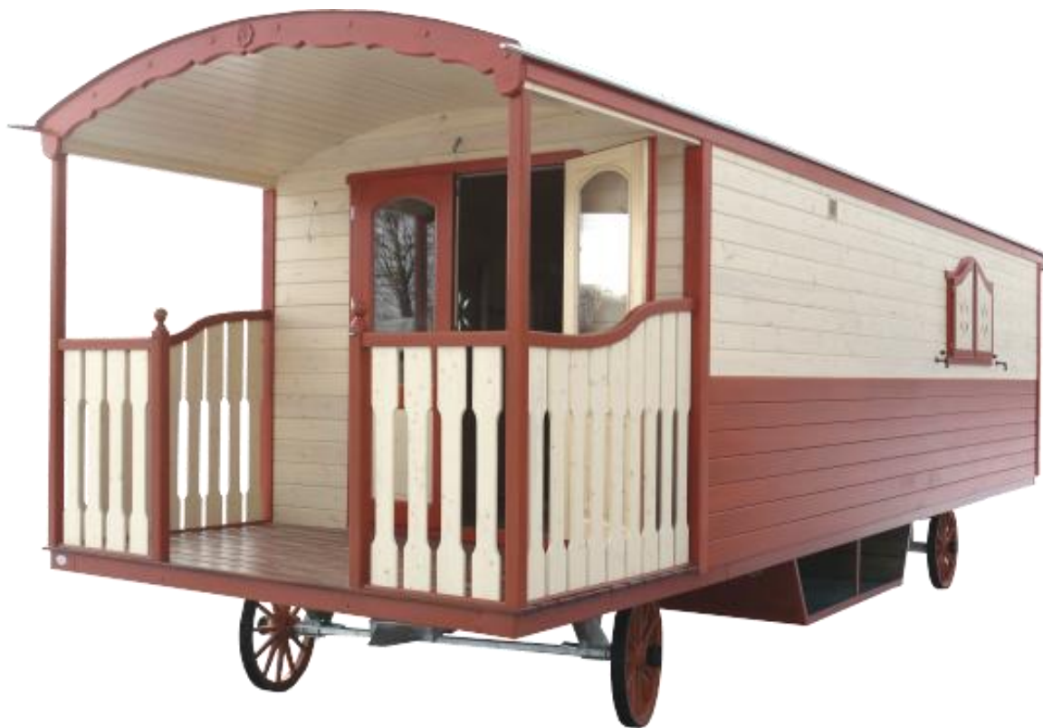
N°1 Roulotte « Margaret »